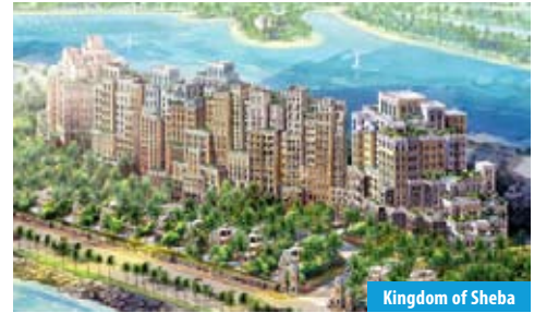
Kingdom of Sheba