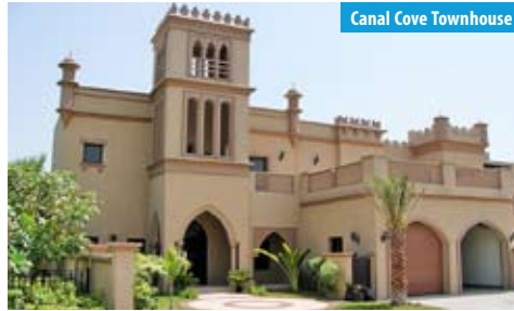
Canal Cove Townhouse