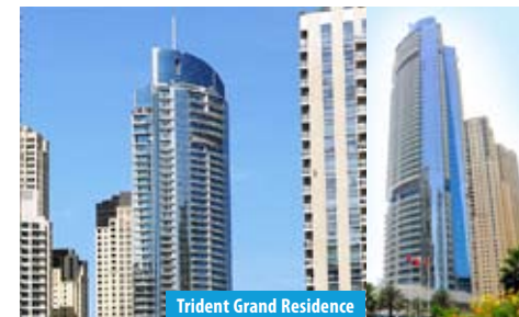
Trident Grand Residence

ROYAL OCEANIC 34-этажное жилое здание на берегу моря. Расположено напротив 5* отеля Le Royal Meridien в районе Dubai Marina. Квартиры – от студий (51-62 кв. м) до пентхаусов (325 кв. м) US$ 3500 – 4000 за кв. м